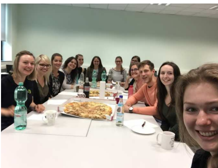
Die obligatorische Pizza zur Mittagspause ist mittlerweile fester Bestandteil jedes Basisworkshops der btS :-).