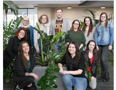
Das Team der btS Saarbrücken im Juli 2019.

Zur Umsetzung von Veranstaltungen und Projekten werden motivierte Mit-